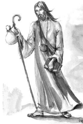
Santiago Apóstol 25 de julio